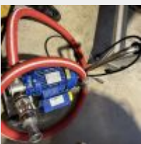
Lot n° 10 Pompe LIVERANI Midex sur petit chariot inox Mise à prix : 50 €