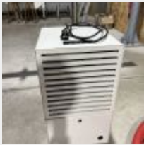
Lot n° 20 Déshumidificateur SECOSTEEL semi industriel TEDDINGTON Acheté environ 1248 e TTC, 1/2024 Mise à prix : 300 €