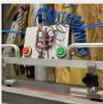
Lot n° 22 Chaîne de mise en bouteille, étiquetage, capsulage : - Pince de dépalettisation pneumatique BUTROT sur potence, suspenseur TECNA - Convoyeur motorisé de 3 m BUTROT, Marquage des étiquettes - Étiquetage (étiqueteuse 1 tête), Marquage jet d'encre en ligne - Remplisseuse, Capsuleuse BARIDA ISO 5-AC isobar 5 têtes de remplissage (capsule couronne 26) - Tête de capsulage - Étoile / contre étoile bière 75 cl, kit entretien (pompes à graisse...) Mise à prix : 15 000 €