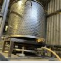
Lot n° 5 Cuve d'empâtage POLSINELLI avec aspirateur motorisé et un brûleur à gaz Mise à prix : 300 €