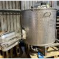
Lot n° 7 Cuve de filtration POLSINELLI 500L avec couteaux reliés à l'agitateur, fond filtrant, trou d'homme rectangulaire (pelle) Mise à prix : 300 €