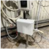
Lot n° 19 Enfuteuse avec compteur électro magnétique MAISON NEUVE (achetée 5/9/2022, environ 3 10.80 € TTC) Mise à prix : 800 €