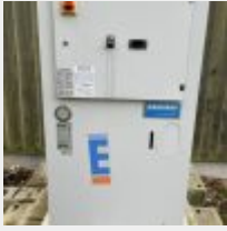
Lot n° 17 Groupe froid (à l'extérieur) EURODIFROID (pour maintenir le glycol froid) Mise à prix : 300 €