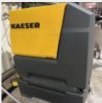
Lot n° 21 Compresseur KAESER icomp8 tower T 2022 Insonorisé avec assécheur intégré N°2114-8735644 Acheté le 15/07/2022, environ 9 689.37 € TTC Mise à prix : 2 500 €