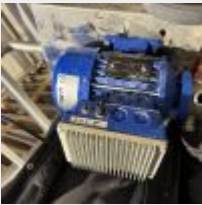
Lot n° 8 Pompe LIVERANI MINIVERTER, sur petit chariot inox Mise à prix : 50 €