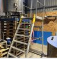
Lot n° 6 Escabeau roulant sécurisé FORTE ALVE Mise à prix : 200 €