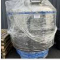
Lot n° 18 Cuve de mélange ALFA LAVAL (protégée sous film - à l'extérieur) pressurisable jusqu'à 1,2 bars 1600 Litres, sur roues Acheté environ 2 106.14 € TTC en juin 2022 Mise à prix : 600 €