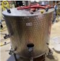
Lot n° 9 2 Cuves d'ébullition inox (1 de 500L et 1 de 300 L), avec 2 supports inox et 2 brûleurs à gaz Mise à prix : 600 €