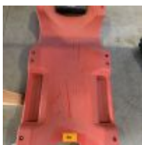
Lot n° 86