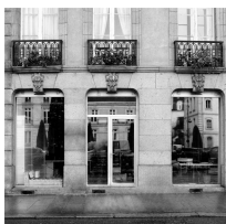
Lot n° 86.3